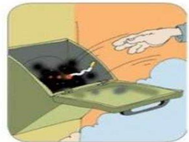
НЕЛЬЗЯ бросать непотушенные окурки в мусоропровод