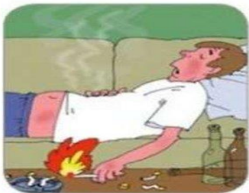
Неосторожное обращение с огнем, курение в постели