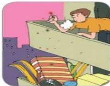
Неосторожное курение на балконе, непотушенные спички, окурки